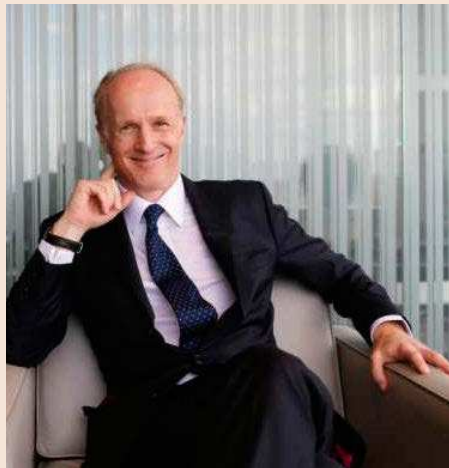
Mark Machin, CEO del fondo de pensiones de Canadá CPPIB.

entre ellos Canada Pension Plan Investment Board (CPPIB), institución que gestiona el ahorro a largo plazo –con vistas a la jubilación– de unos 20 millones de canadienses, y que, con 54.800 millones de dólares asignados en la actualidad a activos de private equity , encabeza el ranking de grandes inversores de Preqin.